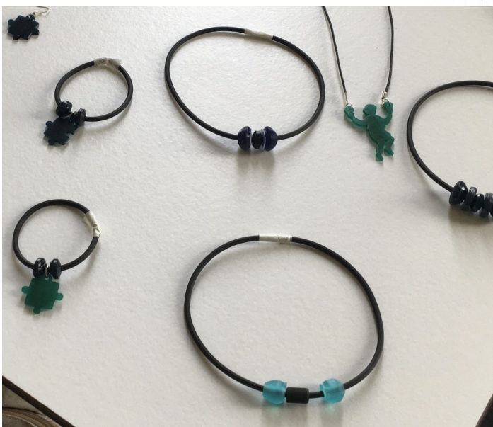
(Alcuni esempi di bigiotteria creati con la stampante 3D)

3°DL prevede la realizzazione di un laboratorio al fine di creare accessori di bigiotteria ma con un tocco di innovazione: utilizzando una stampante 3D.