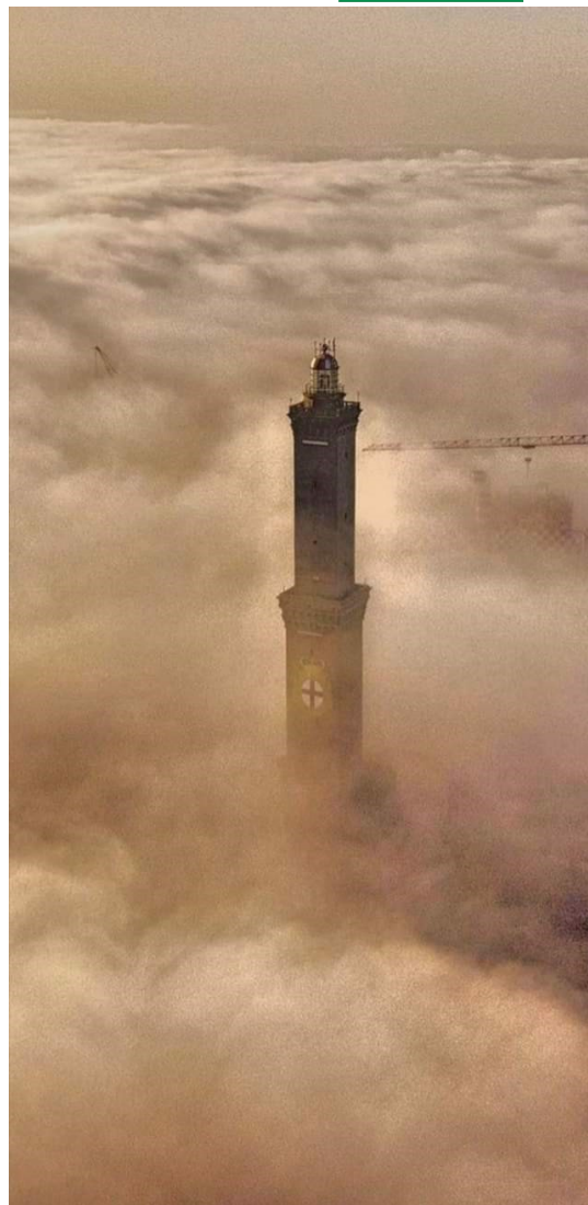
Foto della Lanterna di Genova avvolta dalla nebbia per effetto della Caligo che ha avvolto gran parte della costiera ligure in questi giorni